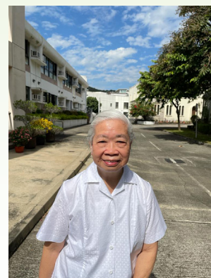
2021年11月攝於寶血會總部會院

然而，疫情後，這些活動均已被取消。「疫情下，我因為年紀大，怕受感染，甚少外出，生活主要是唸經、祈禱、看聖經。退休至今，幸好身體健康尚可以，全賴天天運動，雖然只做10分鐘，但可把身體溫度提升。我現在的生活算是健康也悠閒。」