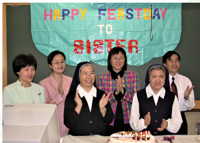
不同年代的校長同時服務上智的時刻