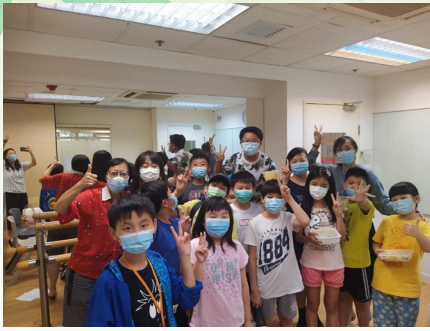
校友會幹事與小朋友留影

校友會各義工多年來協助小童群益會推行活動，讓不同階層的小朋友也可以有聽說英語的機會。以往多由校內同學們策劃及帶領活動，今年因疫情關係，由校友會的義工姐姐及姨姨協助。透過烹飪活動，校友義工指導及鼓勵參加者邊煮邊學英語詞語，讓他們能在輕鬆氣氛下一步步用英文表達。參加者對自己能成功製作精美食物都很開心。希望來年有更多校友參與，讓更多小朋友受惠。