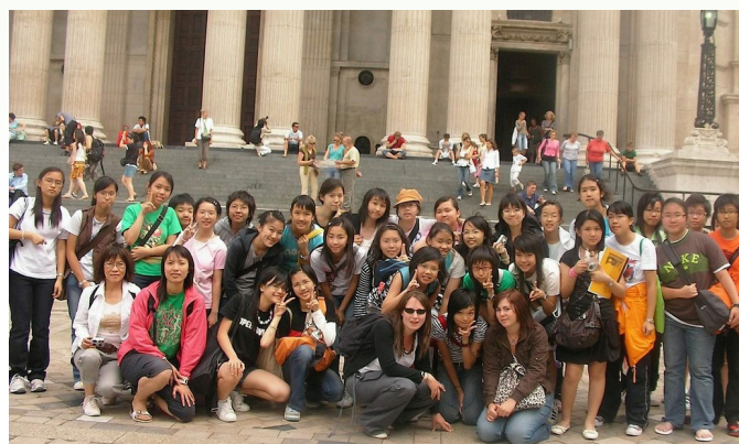
2006年首屆英倫學習團

她透過讓上智參與內地姊妹學校計劃，讓同學與內地有實力的中學師生進行交流學習。上智亦由2006年起舉辦資優課程，每年暑假由3位老師帶領30位中一、二的同學，遠赴英倫學習英國文學和體驗英國文化。這些計劃也鼓勵了老師帶領學生作新嘗試。上智早於2006年已有資訊科技老師帶領同學，代表香港遠赴德國不萊梅參加機械人比賽。這些也是很好的例子。