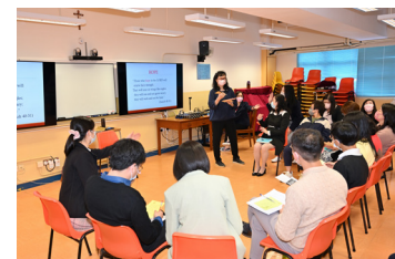
柯太給上智天主教老師作分享