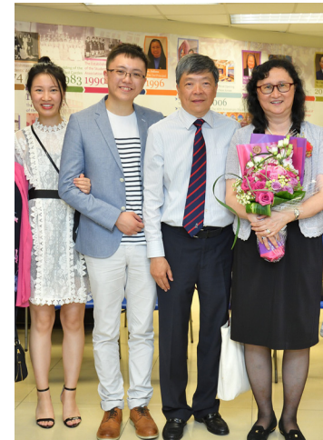
柯先生、柯太兩代同堂