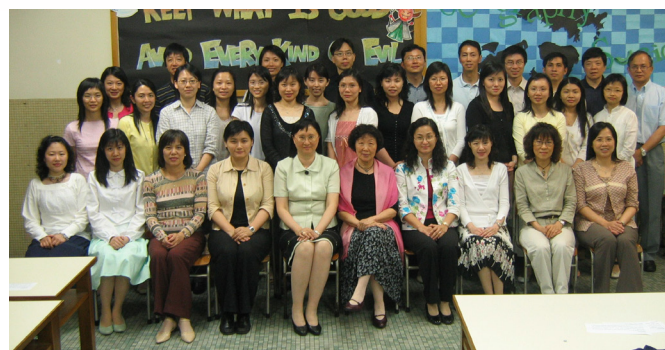
柯太、教育局負責人與32位DOLACEE老師合照

(Development of Language across the Curriculum for English-medium Education)。該計劃由教育局邀請澳洲專家提供培訓，通過“Train the trainers”模式，提高語文科以外的老師以英語教學的效力，幫助老師明白學生學習的難處，透過調校教學法，從而給予適當的幫助。實事求是的柯太，經與老師商討參與計劃的預期成果後，竟破天荒地一口氣安排了32位老師接受培訓。各科老師經培訓後，調整了教學方式，雖仍一貫地以英語教學，但學生卻能更充分理解課堂內容，而老師教學成就感也大增，也反映這教師培訓項目的成功。